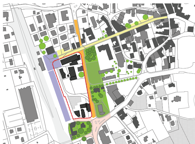
Schéma de diagnostic

Bakker&Blanc, Ecoscan, Energie Concept, De Cerenville, Transitec