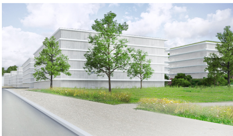
Scénario "en bandes"