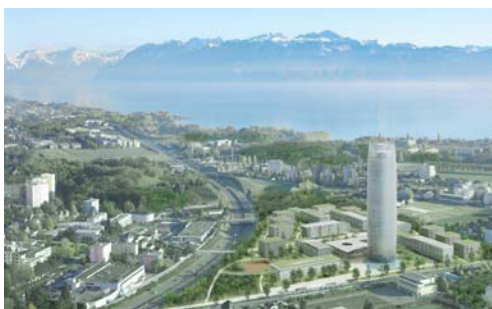
Tour des Cèdres