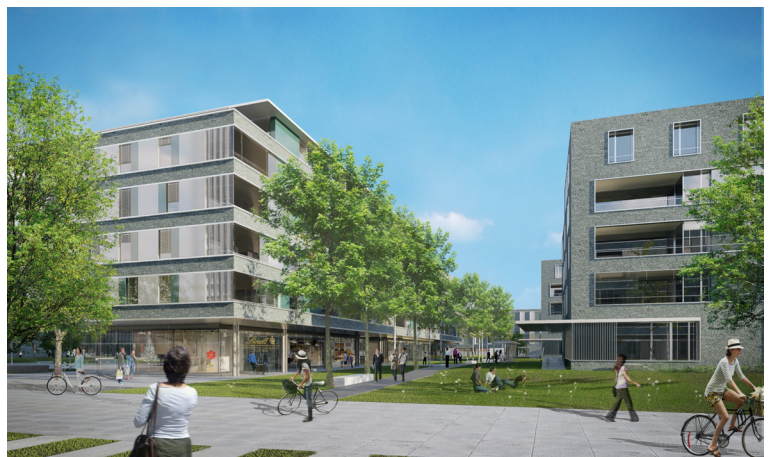
Place du quartier