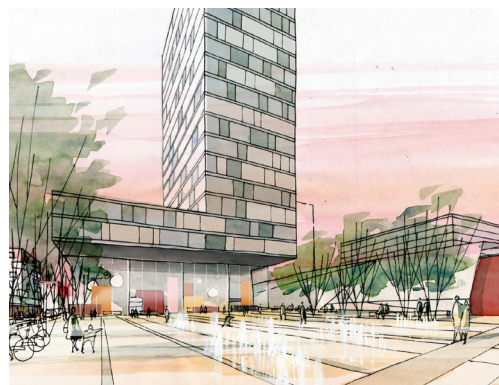
Vue sur un des bâtiments hauts