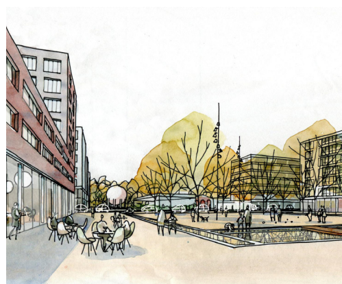
Espaces publics

La population s'est finalement prononcée en faveur du plan de quartier à 58% le 27 novembre 2016. Dès lors, au début de l'année 2017, le plan de quartier est entré en vigueur et un concours d'architecture a été lancé dans la foulée.